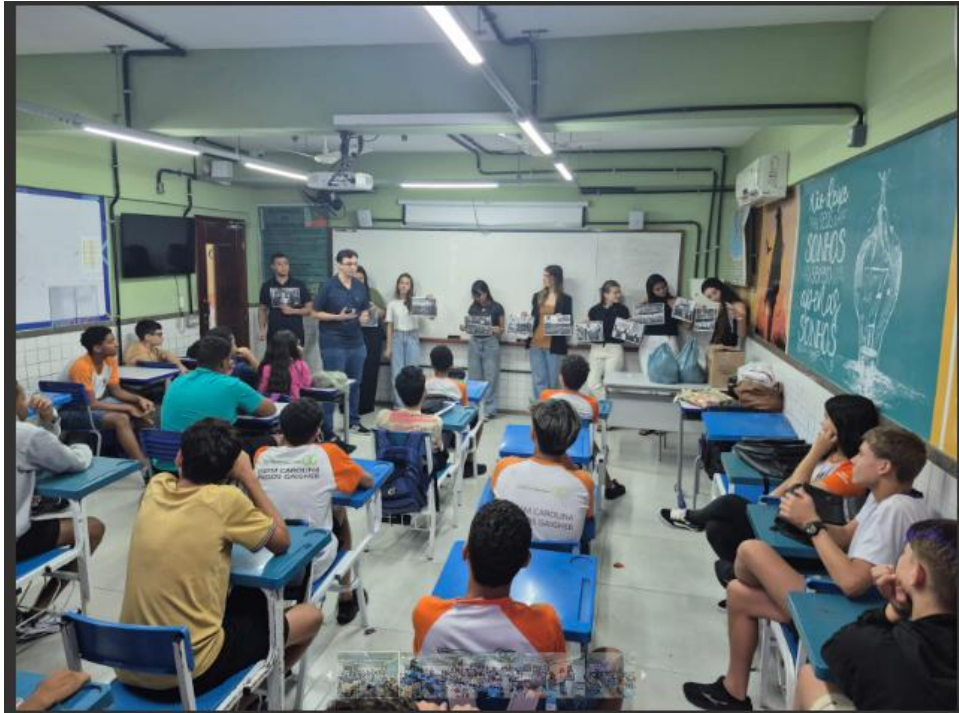
Figura 2. Registro do projeto de curricularização “Cidadania e Justiça também se aprendem na escola”