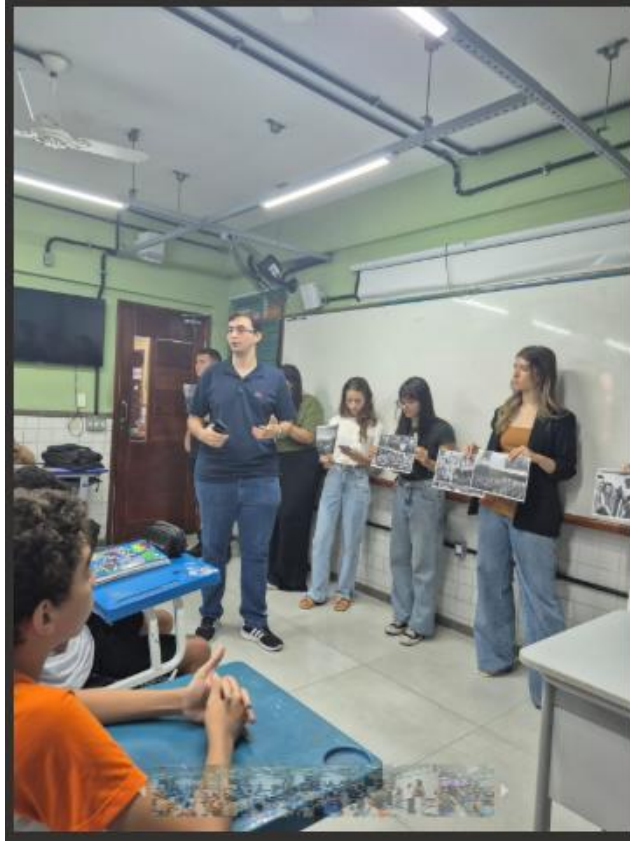
Figura 1. Registro do projeto de curricularização “Cidadania e Justiça também se aprendem na escola”